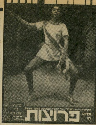
"העולם הזה" 903 תאריך: 3.2.1955

דרישות בית"ר, שנתמכו בידי מכבי, אף כי נציגי בית"ר לא הוזמנו אל השופט. בין השאר הוחלט: