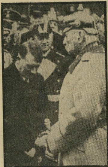
פון היידנבורג והיטלר 30.1.1933