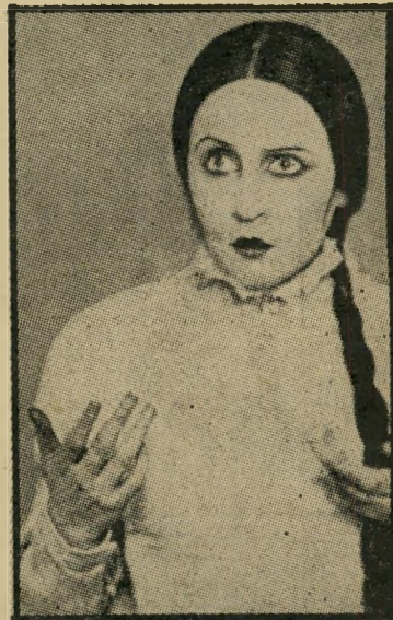
חנה רובינא כהדיבוק 31.1.1922