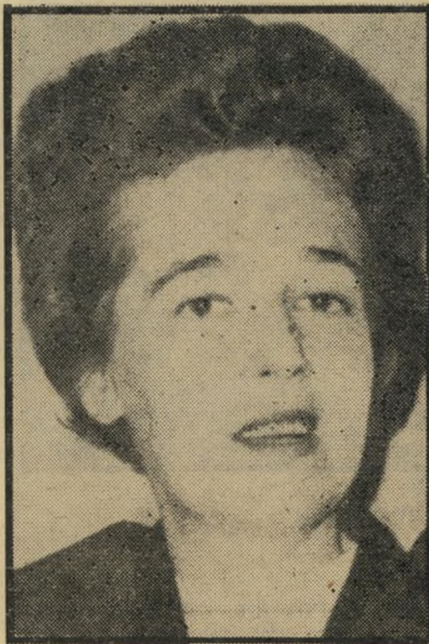
מועמדת ולנשטיין תקן רק לאשה אחת