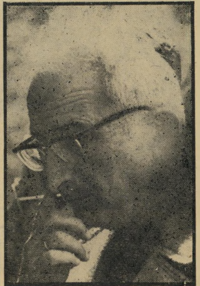
מועמד הוין פסקי-דין מלוטשים