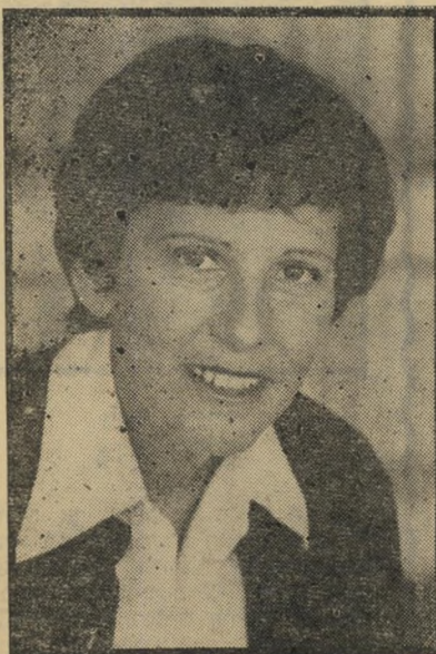
מועמדת בן-יהון הצלחה במחוזי

רק אשה אחת ב התחשב בכל הגורמים הללו ערך העולם הזה תחקיר בין מישפטנים ויודעי דבר בעולם המישפטי, ולהלן כמה השערות שהועלו, לגבי אלה שיתמנו השנה כשופטים עליונים במקום הששה שיפרשו.