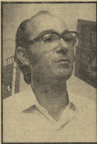
מועמד קדמי דרוש שופט ספרדי