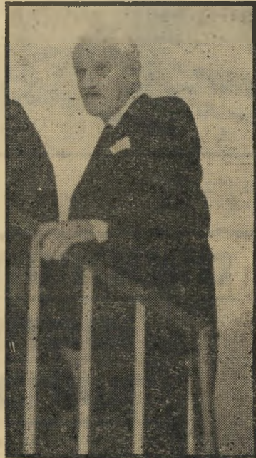
נשיא זוסמן צבע השיער קובע

בתל-אביב, השופט בנימין כהן. למרות היותו ידוע כאדם חכם, בעל לשון שנונה ושכל ישר, מעטים סיכוייו. ראשית, מפני שזה עתה מונה כנשיא בית-המשפט המחוזי בתל-אביב. ושנית, יש אומרים כי כאשר ישב במינוי זמני בבית-המשפט העליון, במשך חודשיים בלבד, לא קנה לו שם ידידים רבים. יש חמנבאים עתיד בבית-המשפט העליון לשופט דב לוין, שהוא ממלא מקום נשיא בית-המשפט המחוזי בתל-אביב. ארץ גם אותם המצדדים בו טוענים שזה עדיין מוקדם מדי. ראשית, מפני שהוא מונה זה עתה כממלא מקום הנשיא, ושנית, הוא היום אחד מעמודי התווך של בית-המשפט המחוזי בתל-אביב, ועדיין לא הגיעה שעתו.