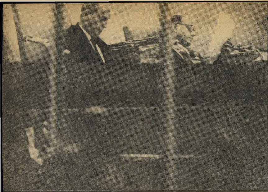
שופט-עיון דנרדי (משמאל) 70 גיל