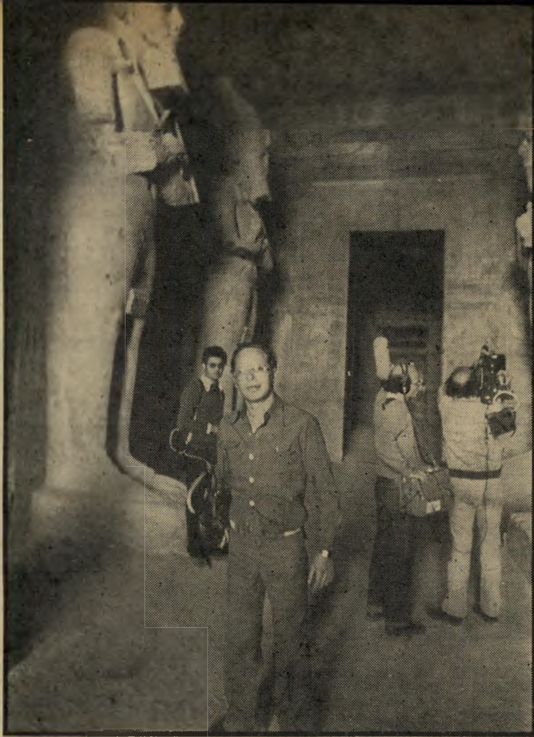
כתב יערי הקרב על קאהיר

מחלקת החדשות לא היתה מוכנה להעלאה הנוספת במחיר החלב, ומבט היה