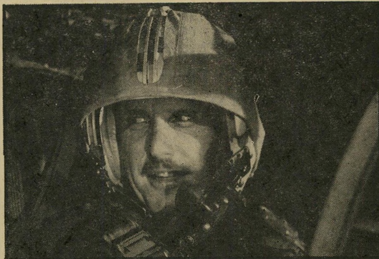
רוברט דובאל כבוד מיצ'ים הטיים הקרבי (המכונה סאטוני הגדול) אחד השחקנים הטובים ביותר באמריקה

באגרופים שלופים. אבל נראה שאם יש תפקיד שנתפר במיוחד על פי מידור תיו, הרי זה תפקידו בטיים שב הבית, סרטו של הבמאי לואיס ג'ון קארלינו —