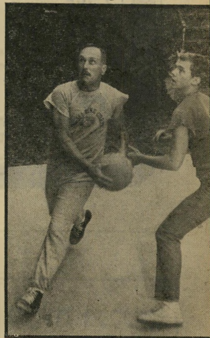
האב ובנו כ"טיים שב הבית" קרב בין עוצמה ורגש

מכנסים למטה, בזרועותיה של "שפתיים לזהות", הקורבן-כביכול, שהוא הרוצח בהשיחה, היועץ הקר והמחושב בסנדק (שני החלקים), או המנהל הקשוח שמנקה את השטח ומפטר ללא רחמים ברשת שיר דור — כל אלה טיפוסים קשוחים להחריב ריד, אולם דובאל החדיר לקשיחות זו כה הרבה אמונה במעשה, כה הרבה נחישות ועקשנות, עד שקשה היה שלא להעריך את האיש, ואולי אפילו להעריך אותו, למרות ניבזותו.