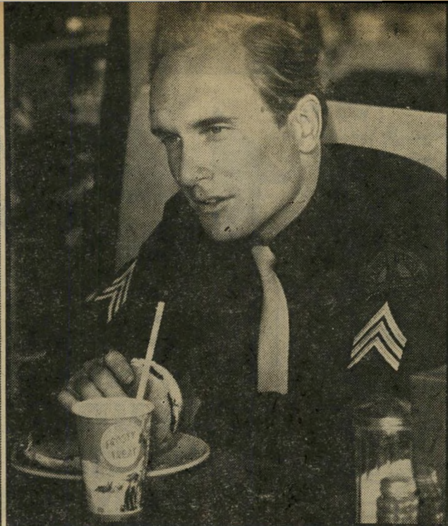
רוברט דובאל, כ"טיים שב הבית"