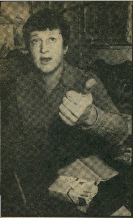
פסיכודוגנית פוגד "חסרי תיקווה"

מכל שלושה אישפוזים פסיכיאטריים הוא אישפוז חוזר.