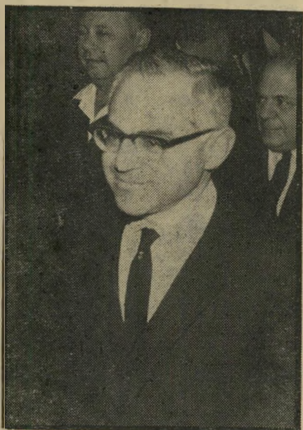
קומוניסט ויזנר גן-עדן או גיהנום?

אולם בינואר גילה, כנראה, שליח רק"ח במוסקבה, כי גן-העדן האפגנאי הפך, משום מה, לגיהנום. הוא כתב מפי השליט הי- חדש של אפגניסתאן: "בני המולדת רבי- הסבל, חיילים קצינים, פועלים, נוער, איני- טליגנציה, איכרים, אנשי כהונה, מאמיי- נים, מוסלמים כנים - סונים ושיעים, גברים ונשים גיבורים של ארצנו... עמי אפגניסתאן: פושטנים, תאגיקים, האז- רייאים, אוזבקים, תורכמנים, בלוצים, נר- ריטאנים ובני-מולדת אחרים, אשר סבלו עד כה דיכוי ועינויים בלתי-ינסבלים מצד