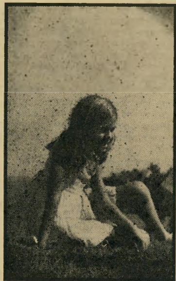
רקדנית החזל בגיל ארבע למדה ניבה בלט קלאסי. היא עזבה את הריקוד אחרי שיחורורה מהצבא.