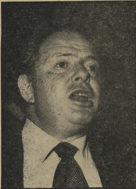
קומיסאר לפיד נגד מרסר, ואגנר, פיקאסו

אחרי שהצליח לטהר את הטלוויזיה הישראלית מטובי אנשים, פונה עתה יוסף לפיד לזירה הבינלאומית.