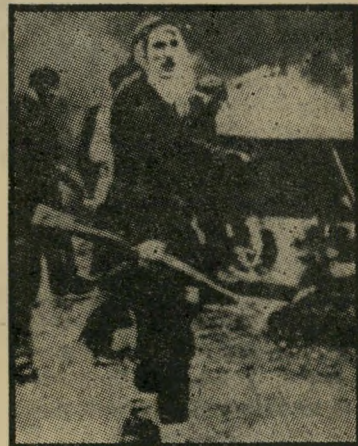
קרב הקסטל 26.1.1948

25.1 — בנימין זאב הרצל נפגש עם האפיפיור פיוס ה-10 המסרב לתמוך ב-ציונות מאחר שהיהודים מסרבים לקבל את הדת הנוצרית.