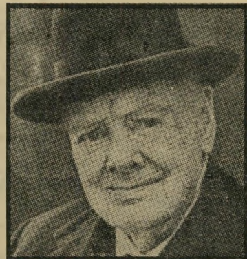
וינסטון צ'רצ'יל 24.1.1965

26.1 — הודו הוכרזה כרפובליקה דמוקרטית במסגרת חברה-העמים-הבריטי. נהרו ראש-הממשלה ושר-החוץ.