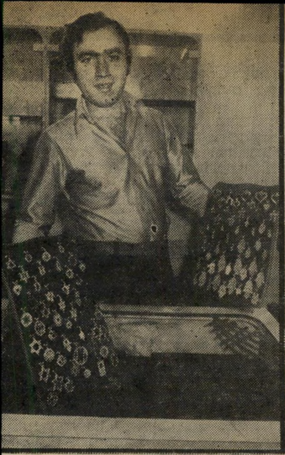
תכשיטאי דזנשווילי אין אשדא

ה צעירה שניצבה לפני חלון-הראווה. שבתות היסטוריות, על כן התכשיטים, שבתות המפוארות גזויות, בדיונגוף-סנטר, הוצגו שעות שבו חשקה מזמן. אך היתרה בחשיב בון הבנק שלה לא הגיעה לסכום הנדרש. לרווחה, הבחינה כי על חלון החנות הדר"בקה התווית: "כאן מכבדים אשדאית" השימוש בכרטיס-האשראי שברשותה היווה פיתרון נוח, שכן בדרך זו יחוייב חש"בונה רק אחרי חודש, אחרי שמסכורתה תגיע לבנק. כך, חשבה, תמנע ממשיכת יתר.