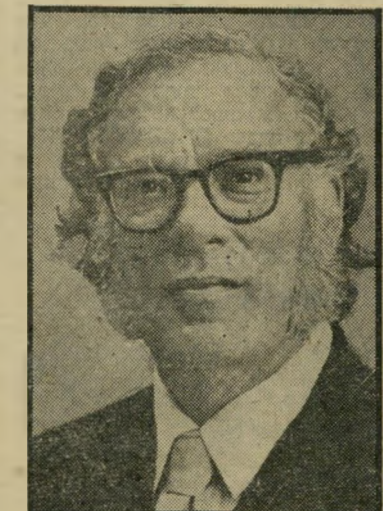
אייזק אסימוב הוא פגש בעצמו

שלושה סוגי מציאות קיימים בספר הזן כל זמן מאת אייזק אסימוב , שראה אור באחרונה: המציאות של הזמן , המציאות של הכרובות , והמציאות של