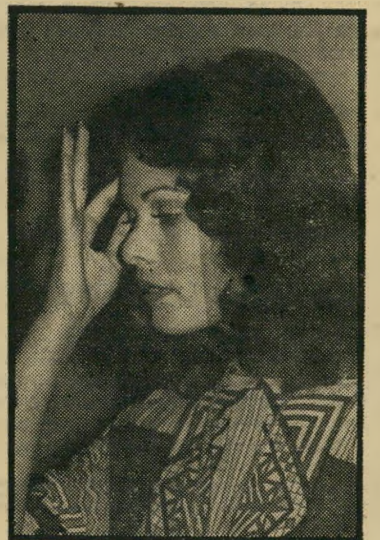
רינה מור אפשר לאהוב בארץ

יש המון חתיכות יפות ומשגעות בתל־אביב. אבל רינה מור, שהיא גם יפה אמיתית וגם מיס־תבל אמיתית, יש רק אחת. מי שדאג לחיי־האהבה שלה, שלמען האמת היו קצת מחוץ לכותרות בזמן הרחוק, יכול להירגע. אני, בכל אופן, לא דואגת, כי פשוט יש מי שדואג לה.