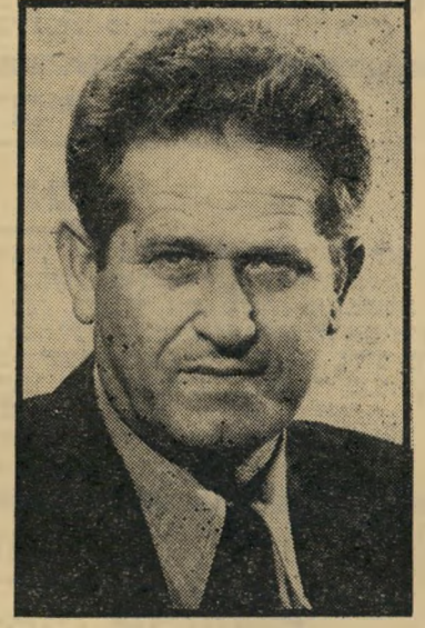
סגן-שר ציפורי גם הוא בחקלאים

מושבה שמקימה התאחדות-האיכרים בשטח קיבוץ גזר לשעבר, ליד רמלה, אשר נועדה לבני-איכרים שצו להם ה-