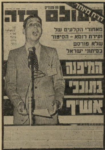
שער "העולם הזה" (2196) ללא טכסט כתוב

כאדם דתי אני רוצה לגלות לקוראים הי לא-דתיים של העולם הזה, שהם בורים ורעמי-אוצות בכל הנוגע להלך מחשבתם של גדולי-התורה של אגודת-ישראל.