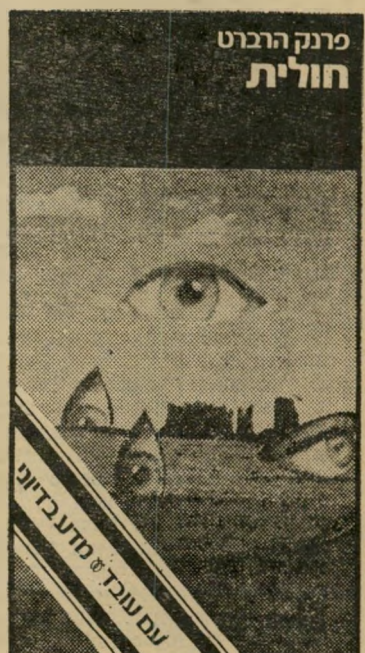
שער הספר "חוליות" מילון למונחי הקיסרות

ההתרחשויות מתנהלות במידבריות, שריח מידבריות-ערב נודף מהן, זה עולם בלא ריכוזים אורבניים. עולם של סופות מפחידות, עולם של מין בדואים שסגילו לעצמם אמצעים מתחכמים ביותר לשם שמירת מקורותיהם בישימון. מצוי בר חולית עולם נוסף של בנות גישרות ה עשויות להזכיר את בנות המהפכה הפרי סית, המיפיעות בימים אלה, חדשות לבק