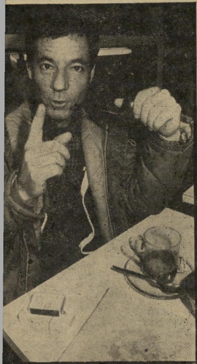
יושב-ראש איגוד רז תקנות מספיקות

עירום ב"פנטהאוז" אורזולה נתגלתה על-ידי הירחון האמריקאי פנטהאוז אחרי שהתפשטה בעבר עבור יר"חונים גרמניים. הם הטיסו אותה במיוחד לארצות-הברית כדי לצלם סידרת תמונות זו.