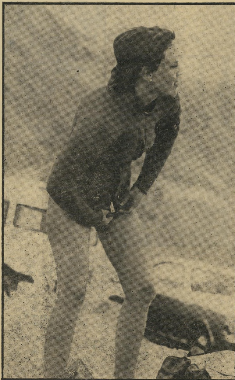
צוללנית בים-סוף הקורבן האחרון היה אשה