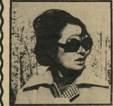
אורה נמיר לא 1997

אני לא יודעת למה זה לא המשיך ללכת, אבל אני יודעת שהפעמונים המשיכו לצל-