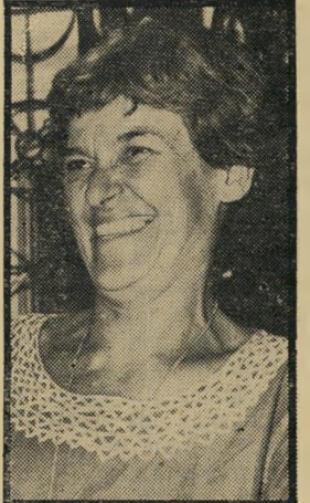
סיפור אישי: פורת יום חמישי, שעה 10.15

כדורסל (8.30) . אם הנהלת מכבי תל-אביב תסכים, ועל כך יוחלט רק ברגע האחרון, על פי קצב מכירת הכרטיסים, ישודר מישחק הכדורסל בין מכבי תל-אביב לקבוצה מבולגריה בשידור חי. אישי ארנה - סיפור אישי (10.15) . כיצד אפשר