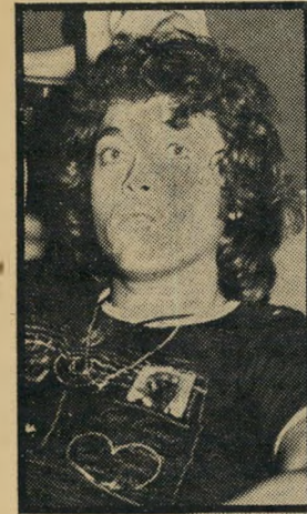
בצוותא: ארצי יום שלישי, שעה 9.40

קורטוב של רכש (10.05) . הודמנות לראות את הסרט המפורסם. הסרט נימנה על אסכולת סרטי כיווי-המיטבח והוא מגולל את סיפורה של צעירה שעזבה את הבית בעקבות נישואי אמה והיא מתגורר