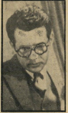
שאיפה: שיין יום שישי, שעה 10.20

איליין ודני מנסים להגיע להבנה. איליין מגלה לדני מה מניע אותה להתנהג בצורה כה מרגיזה. קרול מבינה לג'ורד הפתעה והוא נאלץ להיפגש עם אביה. לברט ומרי יש בעיה חדשה: ברט עובד יומם וליילה ומרי כמעט שאינה רואה אותו. גם ברט מספר למרי מה מניע אותו להתנהג כפי שהוא מתנהג. מרי מביאה לבית טייט עוגה שאפתה, לרגל שיחרורו של צ'סטר מביית-החולים ונשות המישפחה יושבות ומקוננות זו באוזניו על על תיסכוליהן ביחסים עם גברים. ערב אחד עוזב דני