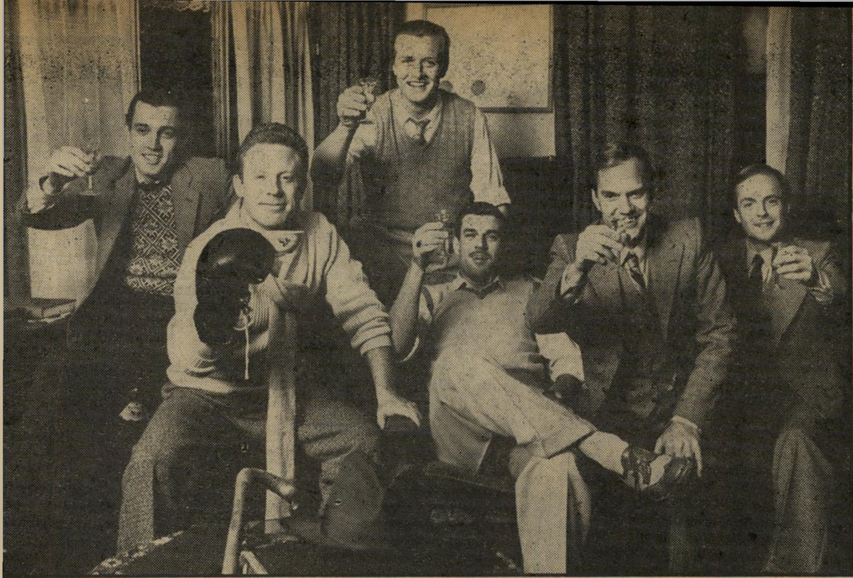
תמונת מחזור - ששת החברים לפני שהיו גיבורים בשורת מלחמה במישחק טניס

שמו העברי של הסרט ניתן לו מפני שהסיפור מתרכז סביב שישה חברים - צעירים, תמימים וחסרי-דאגות - ערב פרוץ המלחמה, ומתאר את דרכם המזווה העקלקלה בשנות המלחמה, שרק שניים יוכו לראות את סופה. כזכריו של הבמאי פול ורהבן, זו צניחה להיות תמונה של קבוצת אנשים קטנה שנאלצת להיות בי