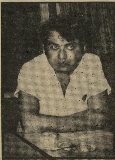
יו"ר דיילים שווארץ מי מגיש לבעל-הבית