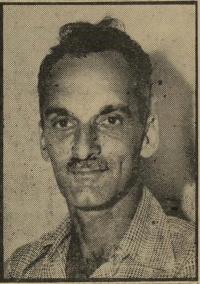
מנכ"ל הרלב בעל-הבית משוגע