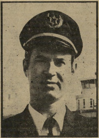
יו"ר טייסים היכל חברים של בעל-הבית