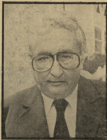
פניגור לאדו רוצה שיעורי-בית

שלוש פעמים בשבוע מתכנסים השופי טים באולם קודר מאבן ירושלמית עבה,