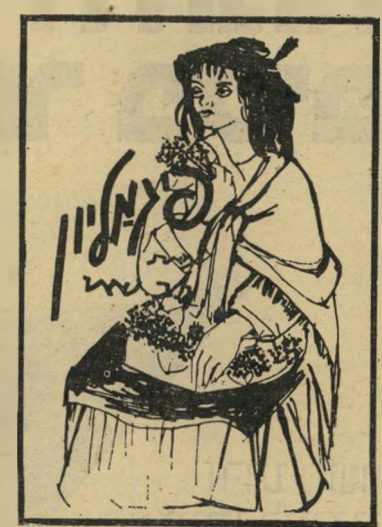
חנה מרון בפיגמליון 10.1.1954

15.1 - רוזה לוקסמבורג וקארל ליב- נכנסו מנהיגי השמאל, נרצחו. לוקסמבורג היתה בת 49 במותה.