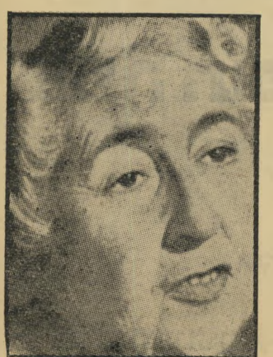
אנאתה כריסטי 13.1.1976

10.1 - חיים לנדאו ומשה ניסים הצי- טרפו לממשלה. 15.1 - מדד יוקר המחיה עלה בחור- דש דצמבר בשני אחוזים. עליית המדד בשנת 1977 הגיעה לשיא: 42 אחוז.