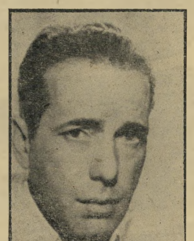
האמפרי בוגרט 14.1.1957

10.1 - הסופר האמריקאי סינקלר לואיס, נפטר בגיל 66. 11.1 - לראשונה עוגנת אוניה ישר- אלית בנמל רוסי. האוניה ריחו פרקה פרי הדר בנמל אודסה. 15.1 - אילזה קוך, המיפלצת מבוכני וואלד, נדונה על-ידי בית-המשפט גרמני למאסר עולם.