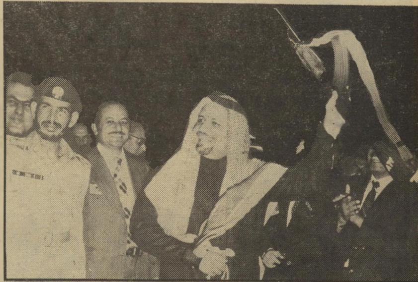
1979: שר-הנפט הסעודי מריע בוועידת אופ"ק

בפעם הראשונה בתולדות המדינה נקי בע כי שר מרכזי — אריאל שרון — יכול להחזיק במיפעל-ענק פרטי, בשעה שהוא עומד בראש המשרד הממשלתי המקבל יום-יום החלטות העשויות להעי-שיר את עצמו. גם כמה מעמדי-התחור ה-אחרים של המימסד החדש, לא פיגרו אחי-ריו בהרבה, בלומסד דירות-השרד, המכוני