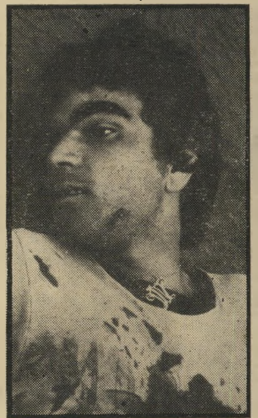
נרצח הסוהן * מודה, לא מודה

עורך-הדין שפטל, שמטפל עתה בכמה עשרות תיקים כאלה, הסב את תשומת לב בתי-הדין שפטל לכך שאמצעי-ההתיקשות הולעטו בידיעות מופצות של המישטרה