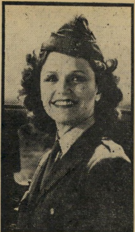
אייק: רמיק יום שבת, שעה 10.05