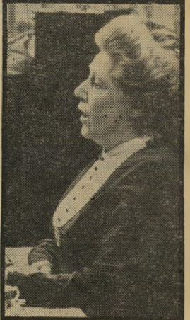
משרתים: ברייג'ס יום רביעי, שעה 8.00

● רעות (11.15). ומשעשע. מישפחת פלוצקי הצעירה עוברת לגור בבית טייט, לא לפני שהוכמר- לשעבר טים מחליט כי הוא מקולל. ג'ודי מספר לדגיס ידידו כי הציע נישואין לקי- רול, ודגיס הפגוע מאיים עליו שהנישואין לא יצליחו. המרצה של מרי קמבל מסיע אותה הביתה מהאניברסיטה ומזמין את עצמו לכוס קפה, וכך קר- רה שעוד אדם מהעולם החי- צון עורך הכרות עם המישי- פחה המטרופת. דאץ' ייוניס שוב מתאחדים לזמן קצר, ו- צ'יסטר מתעורר בבית-החולים, מי שנדהם מהחלתו של צ'יס- טר הוא הרופא שלו.