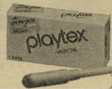
אבנת | קרמון | שיפריין | נעמן