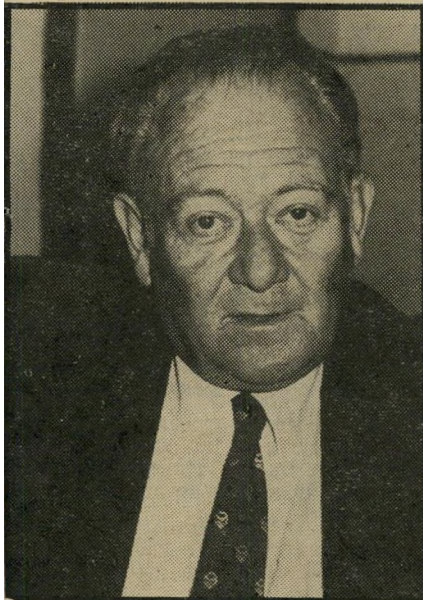
פרקליט נידאון להסתפק בתעודת-זיהוי

עתי-האצבעות במיקרה דגן היותה גם עבירה פלילית של תקיפה, וכן עוולה אזרי-חית של מעצר שווא. למיטב ידיעת העור-תרת — שיגרת נטילת טביעות-האצבעות על-ידי מישטרת-ישראל הינה בלתי-חוקית באלף מתוך 1001 מיקרים בחקירה — מהם יותר ממחצית אינם מגיעים לתביעות, כך שפרט לעניינה הלגיטימי הפרטי של הי-עותרת, קיים כאן אינטרס ציבורי-כללי פרי-אקסלנס.