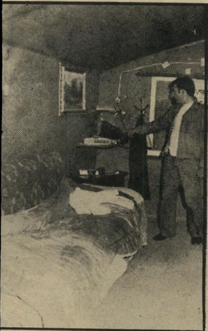
המיטה בצריף האורגיות. אחרי מעצרו של רחמים החליטה המישפחה להרוס את הצריף.

במישפחה כדי שלא תהיה בושה למישפחה. כדי שהורים שלה לא יגלו באמת מי היא.