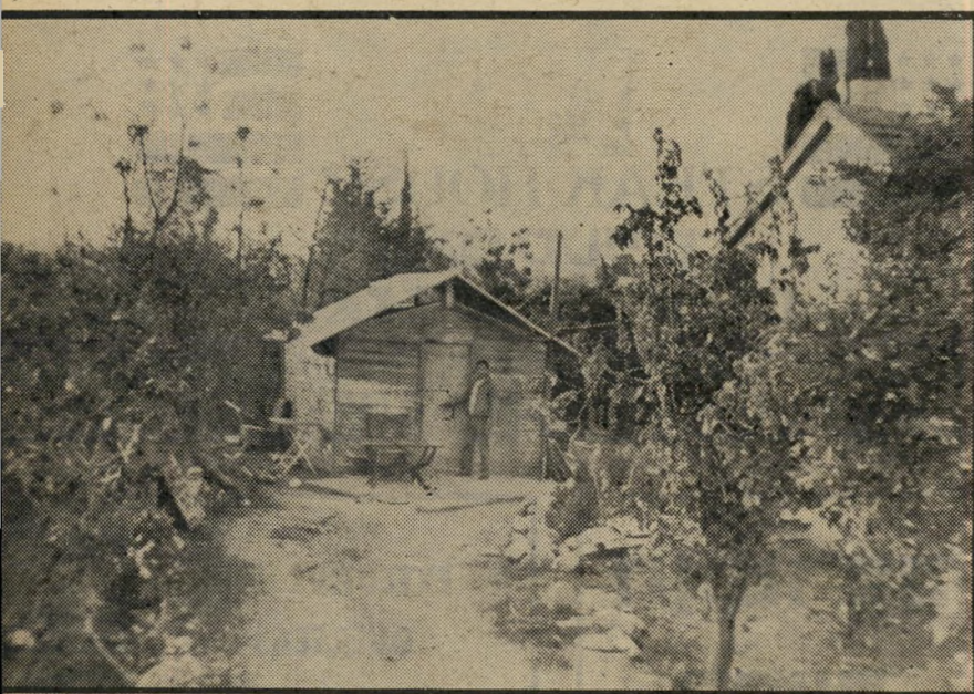
צדיק האורגיות בראשי-העין שבו בוצע האונס הקבוצתי של קטינה, שהובאה על-ידי קטינה אחרת המכונה "השוועלה". בהפרש של חודש נאשמו שני האחים באונס באותו הצריף, האחד נידון, השני זוכה.