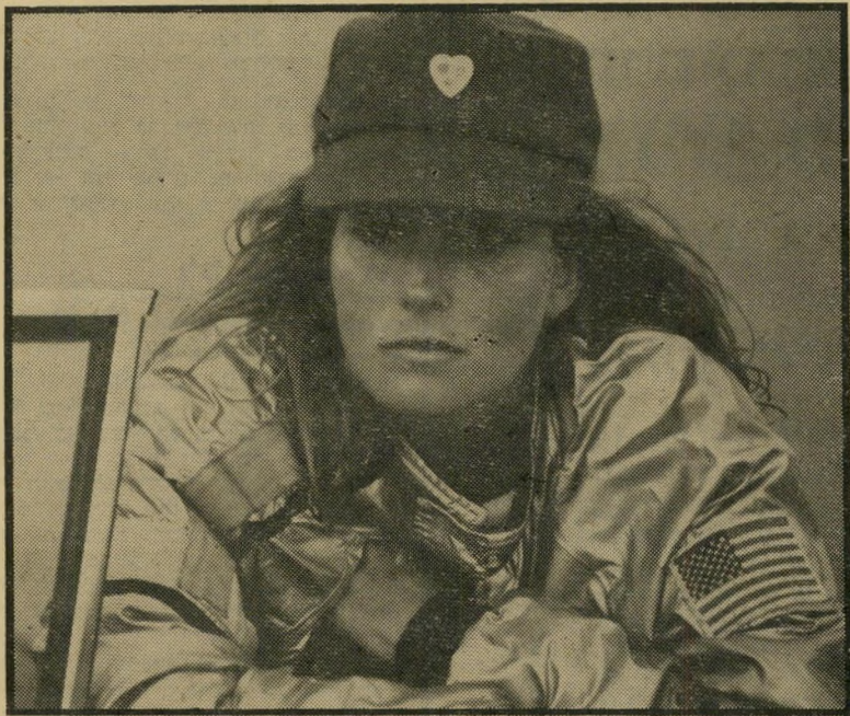
בו דרק כדוגמנית צילום חווה עדיפה על קאריירה