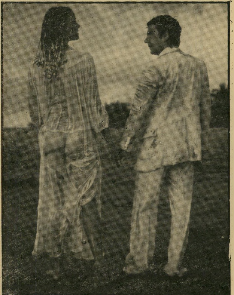
בו דרק ודאדלי מור ב"10" ציון "11" בדירוג מ' עד 10

מה הזאת, הוא מרי קאתלין קולינס, שם שיגרתי ומצוי. למולה, כשהיתה בת 16, ופרשה מביתה הספר כדי להתחיל בקאריירה של דוגמנות, הוצע לה להופיע בתפקיד ראשי בסרט לא כל כך ראשי בשם היה פנס. במאי הסרט היה שחקן קולנוע יפהפה, ג'ון דרק (הוא היה יהושע בן-נון בעשרת הדברות ובן שיית' בי אקסודוס) והוא הגיע לבימת הצילומים ביוון יחד עם רעייתו השחקנית לינדה אוונס.