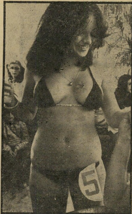
מתחרה אוזיביה תמימה

אי-אפשר היה למצוא דמיון בין הדיסקו לבין הקפיצות שעל הבמה. זה שבחר, החר ליט, כיוון והחמיא היה כוכב עליון מיובא מהצפון — דודו טופו. החוף התמלא והלך. 7000 אילתים התיאספו ובאו. פה ושם נשמעה שאלה בי-שוודית ותשובה בצרפתית, אך הרוב היו ישראלים. "גורמים בכירים" על החוף סיפיקו, שהמלך תוסיין הגיע באותו הבוקר לעקבה הסמוכה. מפה לאזון נלחש, שהוד מלכותו משקיף על הנערות האילתיות וכי הוא מחפש לו אשה חדשה. מי יודע. היפהפיות המקומיות הופיעו במיטב ה"מלבושים. הקיץ שלט והשמש יוקדת את את מעיל הפרווה הקצר חובה להראות לחברים, את המגטיים — לתירייר, ואת צעיף הצמר — לאורחים. דודו טופו עושה על הבמה ככל יכולתו. בין פחית לפחית של בירה הוא מפרח את