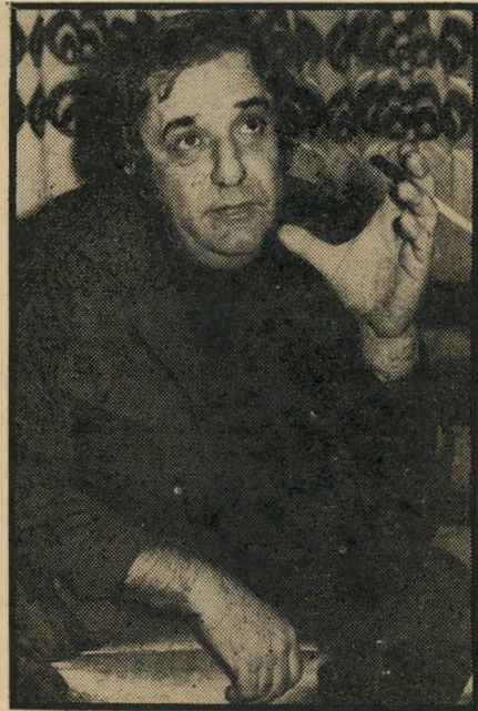
מנהל-סניף בן „מצב חמור מאד“