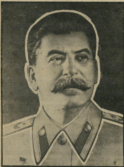
יוזף סטאלין טיהור לרוצח-המונים?

בפירסומים רשמיים על מילחמת-העולם השנייה מובלט שוב חלקו בניצחון על הנאצים ומוצנע הטיהור