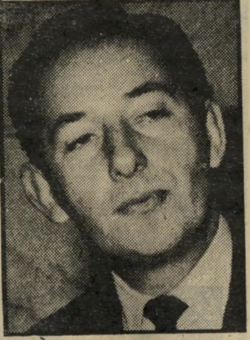
יושב-ראש סמיין זונות, הימורים וגוש-אמנים

בישראל התחליף עלול להיות גרוע יותר, ולעתים קרובות הוא בשר חמוצים וסוסים, ללא כל פיקוח.