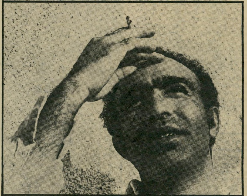
שוטר צבאי קאפה שני אגרופים בחזה

בינתים מינתה מיטרה באשקלון קצין בודק, כדי שיטפל בתלונתו של השוטר הצבאי. שתי המיטרות — האזרחית והצבאית — ממתנות עתה לתוצאות הבדיקה.