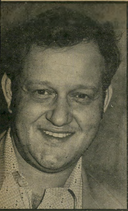
כתב שילון בגין הסכים