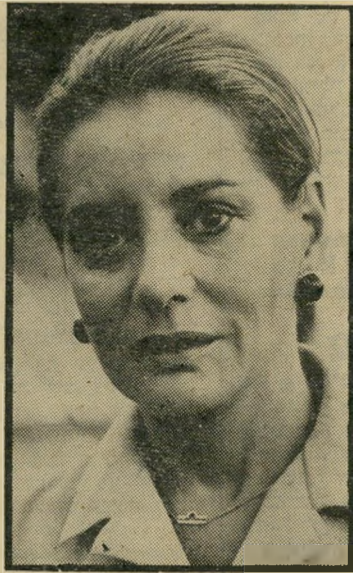
מראיינת וולטרס סאדאת חכם

במיסגרת מיוחדת שישודר ברדיו בשבת ה-29 בחודש, יובא ראיון מיוחד שעשה כתב הרשות, דן שילון, עם מראיינת-הראיון נות'המייחדים הידועה בעולם, כרברה וולטרס. תוכן הראיון שישודר נוגע ב- עיקר לבעיות המרחב.