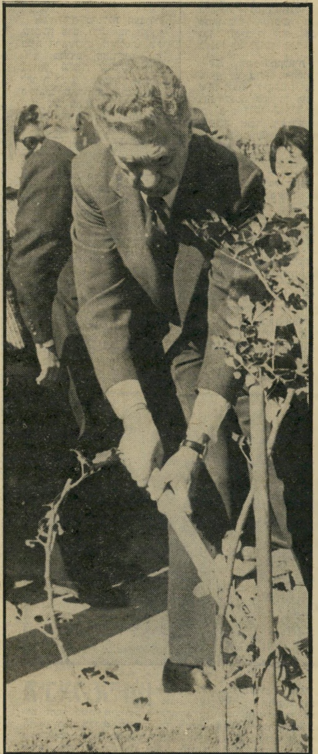
סול לינוביץ השגריר האמריקאי המיוחד למרחב שהוא יהודי, נקלע ל"יד ושם" בירושלים, כאשר בני מישפת-פרטיזנים משוודיה נטעו עץ בשדרות חסידי-העולם לזכר אביהם שנרצח על-ידי הנאצים. לינוביץ, שהתבקש על-ידי בני-המישפחה לטעת את העץ בשםם, התרגש עד דמעות מהמחווה.