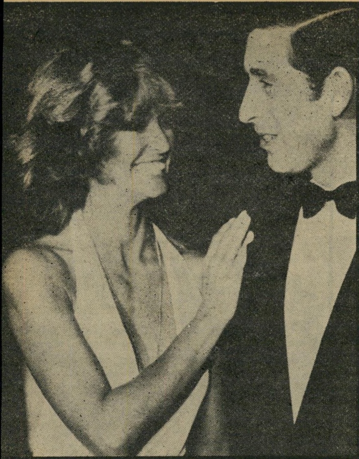
צ'ארלס עם פארה פוסט: ברכת המלאך