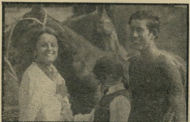
אהבת הספורטאים: ליידי ג'יין וולסלי