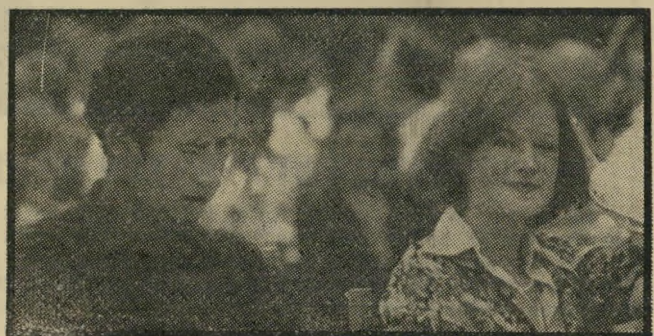
אהבה פומבית: שרה ספנדר בת טיפוחיה של המלכה

אמנם כגבר מקסים, אבל צ'ארלס רלס רחוק מלהיות דומה לו פיסית. יש לו לחיים ורודות, עיניים כחולות קטנות, המתרוצצות במבוכה לעתים קרובות, ומיבנה גוף לא ספורטיבי במיוחד. ובכל זאת יש לו קסם. כך מסתבר מהרפתקותיו הרבות, שאינן גורמות נחת או שקט נפשי לאמו, המלכה אליזבת השנייה. לעומת אן בת ה-23, שכבר נשואה, מתגאה צ'ארלס, המוכתר גם כנסיך מוולס, על כי הגיע לגיל 30 בעודו רווק. בכך הוא שונה מאבותיו. אביו התחתן עם אמו כשהוא היה בן 26 והיא בת 21. סבו, המלך ג'ורג' השני, נישא בגיל 27. אבי-סבו, ג'ורג' החמישי, התחתן בגיל 28. אבי-אבי-סבו, אדוארד השלישי — בן 21. אליזבת מודי-אגת: על אלה שהיא בחרה למענו ויתר, ועודנו מתרוצץ עם כוכבות קולנוע.