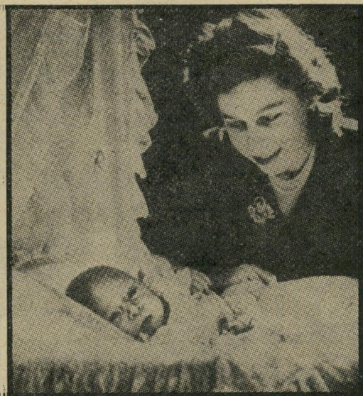
המלכה והנסיך: התמונה הראשונה הסבא והנכד: „סבאאנגליה“ ג'ורג' ה-5