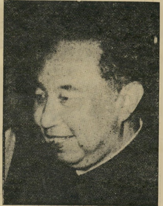
היו"ר הוואה עונש עבור ילד (מיליבד הראשון)