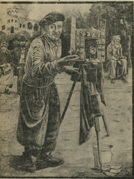
"צלם בשדרות רוטשילד" * זכרונות מתל-אביב הקטנה

מם יכולים להשפיע. הוא זוכר בדברי יגאל תומרקין: "מי היה זוכר את דוכס פירנצה, לורנצו דה-מדיצ'י, לולא פסליו של מיכאלאנג'לו?" תערוכת-יחיד של רפי לביא במוסיאון תל-אביב איננה תערוכה טרנספסקטי-בית. אין זו תערוכה שתיציג את כל תקופות יצירתו לפי סדר כרונולוגי. שבו יעיים לפני התערוכה, עדיין לא ידע רפי אילו עבודות — מתוך שמונים העבודות שהוא בחר וששרה ברייטברג, האוצרת, עזרה לו למיין — תוצגנה, את המיון ערך לפי קנה-המידה האחד — היצירות הנחשבות בעניין כטובות ביותר. כשמייך