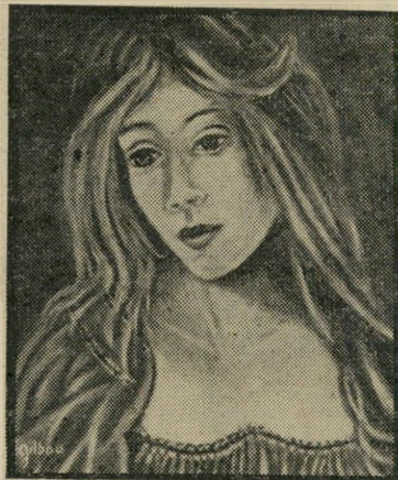
"נערה" של רחל גלבוע נוף דומה בעיבוד שונה

מם יכולים להשפיע. הוא זוכר בדברי יגאל תומרקין: "מי היה זוכר את דוכס פירנצה, לורנצו דה-מדיצ'י, לולא פסליו של מיכאלאנג'לו?" תערוכת-יחיד של רפי לביא במוסיאון תל-אביב איננה תערוכה טרנספסקטי-בית. אין זו תערוכה שתיציג את כל תקופות יצירתו לפי סדר כרונולוגי. שבו יעיים לפני התערוכה, עדיין לא ידע רפי אילו עבודות — מתוך שמונים העבודות שהוא בחר וששרה ברייטברג, האוצרת, עזרה לו למיין — תוצגנה, את המיון ערך לפי קנה-המידה האחד — היצירות הנחשבות בעניין כטובות ביותר. כשמייך