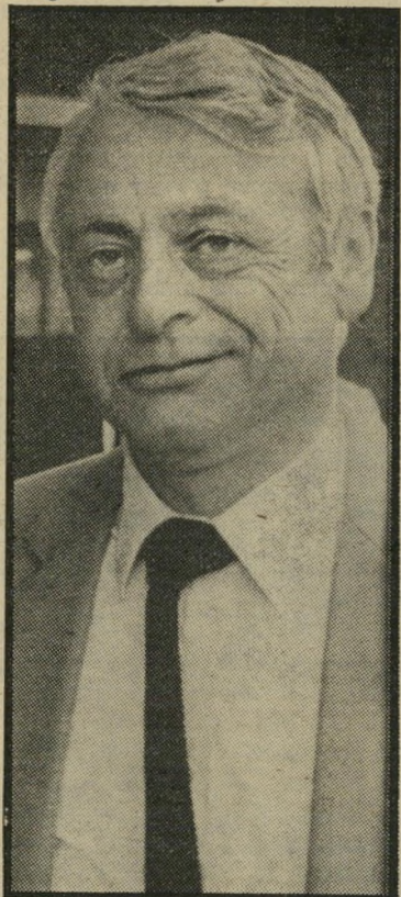
וינטגר בגרמניה להפסיד בחיזון של אושר

מארקים (כימעט שני מיליון ל"י בערך הנוכחי). הוא זכה במישפט - אך לא ראה עד כה פרוטה.