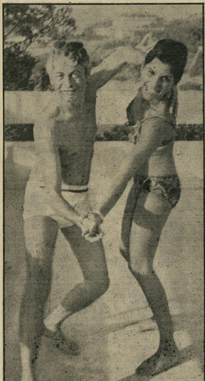
וינטנר וירידה בגרמניה, בימי הזוהר שמפניה ושלוש נשים בבית אחד

או עבר למיקצוע חדש: הוא מכר תמונות ישנות. הן לא היו מזוייפות, חלילה. הן היו אמיתיות לגמרי, אך לא נשאו שמות של ציירים יקרים. וינטנר קנה בכסף טוב תמונות של מומחים, שקבעו כי התמור נותן ציורו בידי רמבראנט וציירים חשודים אחרים, ובכך העלו את המחירים ל-גבהים אגדתיים. כאשר רצה הקונה למי כור את תמונתו היקרה והסתבר לו כי ערכה מועט, חשש ללכת למישרה, מפני