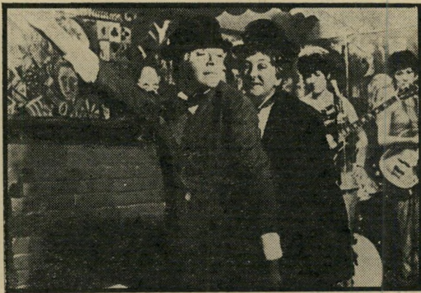
רצח האחות ג'ורג': רייד ויורק יום שני, שעה 9.55

נגד הרוח (10.55) , סידרה אוסטרלית חדשה ומצויינת על אסירים איריים שהוגר לו לאוסטרליה על-ידי המדכי אים הבריטים. כאשר השתח ררו בנו את ביתם ביישבת ה רחוקה. את הסידרה כתבה ברונווין בינס, אוסטרלית שי התגוררה בקירבת קאסל היל, שם שכנו בעבר מחנות האי סירים. היא שמעה אגדות וסי פורים על אותה תקופה והח לייטה לקרוא אותה ולכתוב עליה תסריט לטלוויזיה. במר העלילה עומדת מרי מאל-