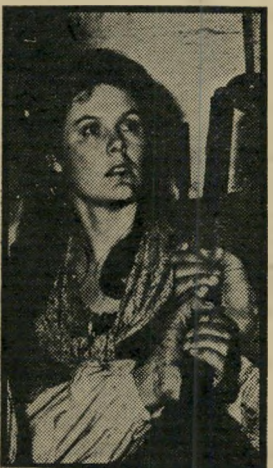
נגד הרוח: לרקין יום ראשון שעה 10.55

רצח האחות ג'ורג' (9.35) , ג'ון באקרידג', השח קנית בריל רייד, מגלמת דמות של שחקנית המגלמת את ה אחות ג'ורג' בסידרת טלוויזיה אנגלית. כשהבמאי מחליט לה רגול את דמותה בסידרה, היא מקוננת באוזני שותפתה לדי רה. אליס מקנטו, השחקנית