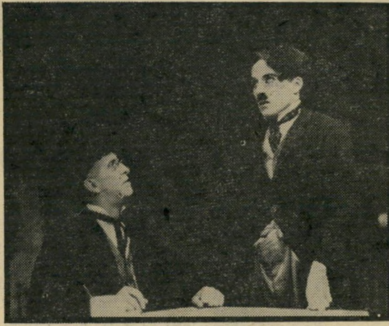
צ'ארלי צ'אפלין: בין פאתוס להומור

החיים המשותפים בחוסר-כל, הארוחות שבהן הדמיון תופס חלק גדול יותר מן המזון, הפרנסות המאולתרות — הילד שובר שמשות וצ'ארלי הזג בא להציע את שירותיו כזג — והעיימות עם שוטרים, יש בהם את כל אותו עושר של המצאות קומיות שבהן הפך צ'אפלין את האדם הקטן לגיבור הגדול ביותר של הקולנוע. מעמדים אחרים, כמו חלום ג'והאדן, הם דוגמה ומופת לפיוט קולנועי, ואילו מעמד שבו עובדים-סוציאליים מנסים