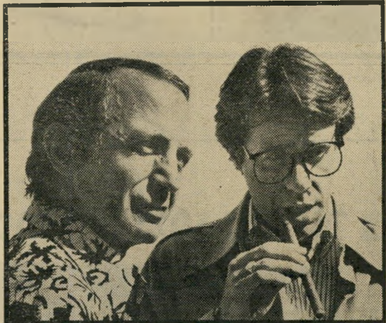
בוגדאנוביץ' וגאזארה: בין ריקבון לאנושיות

יש בסרט משהו מן האידיאליזם שהיה פעם אמת-המידה העיקרית של גיבורי הקולנוע האמריקאי, מריק בליין בקובלנקה ועד ליליפ מארלו בשלום לך יקרתי. הגבר היועד לשמור על עצמו, ומתעקש לשמור על טוהר מידותיו בתוך חברה שנמצאת בתהליך של ריקבון והתפוררות. הפעם בגרסה פחות קשוחה אבל בהחלט לא פחות מעניינת. הגבור הראשי ושלל הטיפוסים סביבו מרתקים, משום שאפילו