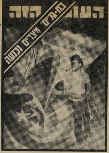
"העולם הזה" 895 תאריך: 9.12.54