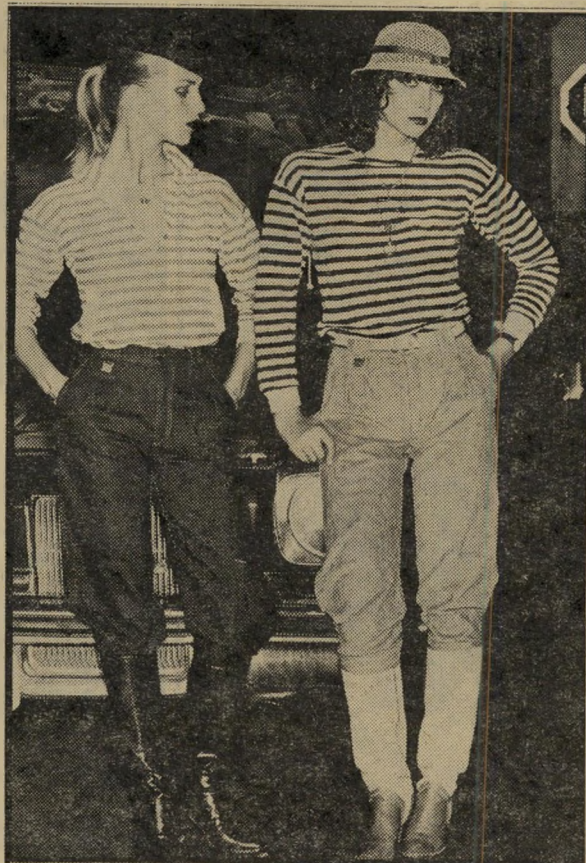
תפיסה חדשה במיכנס הג'ינס החלק העליון רחב והולך וצר כלפי מטה

עם מוצר חדש, יש צורך גם בשם מושך ואקסוטי. משהו שיוכיר לנו טעם משובח או מראות המחממים את הלב בימי החורף הקרים. וכך, בצד אופנת-איפור המדברת על טעם הקוניאק, ואופנה אחרת המדברת על מראה השמש, כפי שסיפרתי לכן בר- מדור זה, נתבררנו עתה על אופנת-איפור חדשה שמציעה לנו חברת רב'לון. המראה החדש באיפור לסתי-חורף 79/80 של חברה זו נקרא „אדום סיני“. הגוון האדום מופיע על מרבית דברי הי-