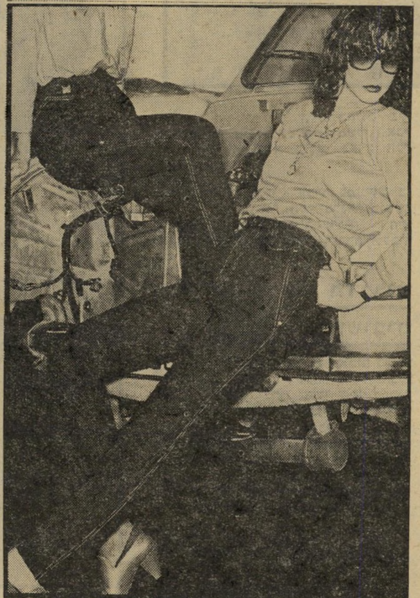
כיווצים כמותניים ותפרים מודרניים

בסיכום, אם ברצונך להתהדר במראה „האדום הסיני“ הכיני 100 ל"י עבור שפ- תון, 95 ל"י עבור לכה לציפורניים, 175 ל"י עבור צללית לעיניים, 145 ל"י עבור סומק ללחיים, והרי את אקסוטי כאתת שעלתה מן המיזרח הרחוק.