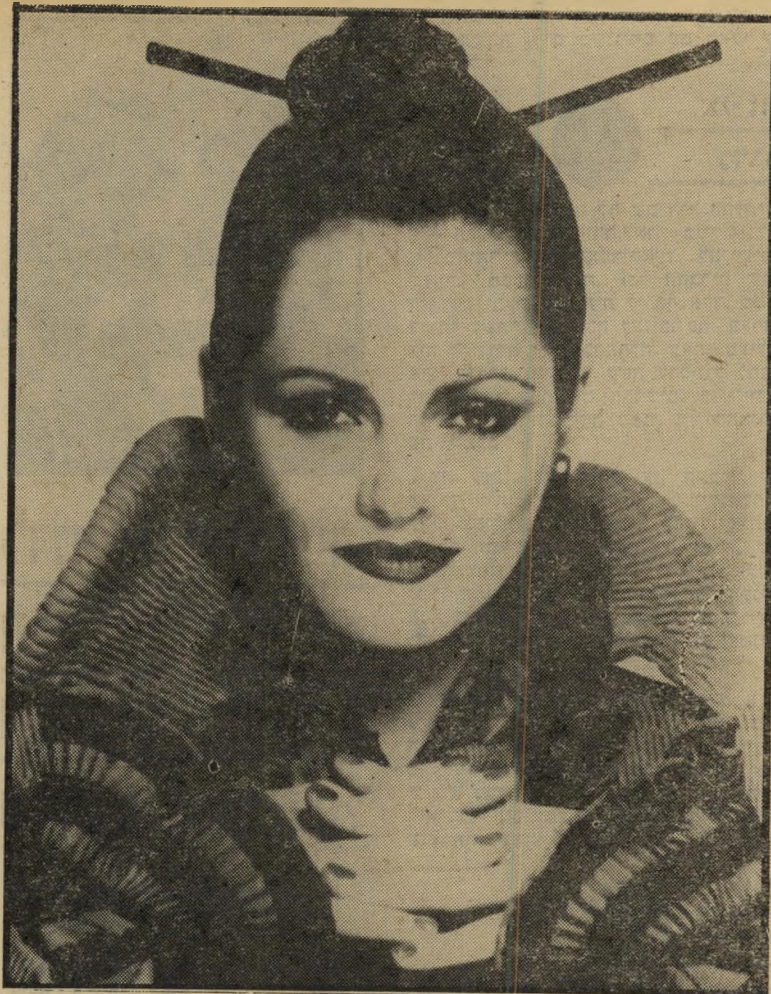
הצבע האדום בהשראת האמנות הסינית אופנת האיפור של „רב'לון“ לחורף '80

אומנות של סין, כמו כדירהס ואגרסלי- תריסנה יקריערך. אדום הוא גם צבע השימחה בסיני, ועל פי המסורת הסינית חתן ההולך לחופה לובש בגדי סאטין ב- גוון אדום בוהק. בגוון האדום הסיני את יכולה למשוח את שפתייך, ואת פניך לאפר בקרם-בסיס מקאפ בגוון אחד בהיר יותר מגוון העור הטיבעי. הלחיים מודגשות בסומק בעל גוון הקינמון, שלא לדבר על הציפורניים, שלהן הותאמה לכה בגוון השפתון.