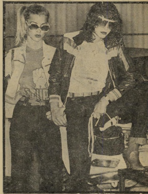
אביזרים לג'ינס כצבע טורקז חגורה, מגפיים, ארנק וחולצה

לאחרונה ייחדנו מקום לנעשה בעולם האיפור. גם בשטח זה יש מדי פעם חידושים, ואפשר לומר שיצרני התכשירים הקוסמיים לא מפגרים אחר מתכנני הר אופנה ומשתדלים להיות חדשנים כמוהם. שמתסלב בוודאי, שאין זה מספיק לצאת