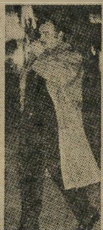
Louis de Marenches, « patron » du SDECE.