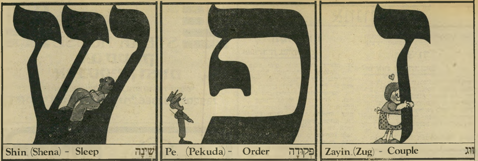
Shin (Shena) - Sleep