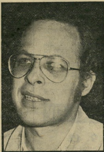
כתב יערי חוקי-לארץ

במשך חודשים אחדים מבטיחים הסוכר ייטים לשרות השידור האירופי אייביין, כי יאפשרו לגילעדי להגיע לכנס ההכנה של שדריהספורט במוסקוה. המועד ה' אחרון שהציב אייביין לרוסיס, כדי לתת