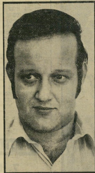
כתב שידון חרם ברדיו

הירידה התלולה, שחלה בזמן האחרון ברמת שידורי מחלקת-הספורט, מדאיגה